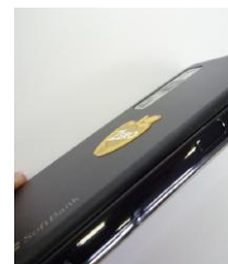
スマホケースにもOK