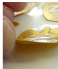
基板回路はそのままに 最新薄型設計