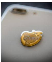
厚みのあるポッティング加工 高級仕上げ