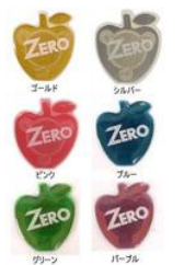
カラーラインナップ